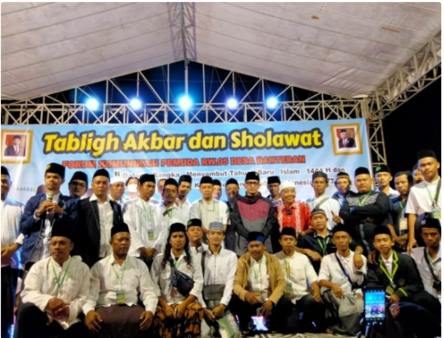
Peringati Hari Besar Islam dan HUT Kemerdekaan RI Ke 77, FKP RW 05 Desa Banteran Adakan Pengajian Akbar

BANYUMAS - Dalam rangka memperingati Tahun Baru Islam 1444 Hijriah dan Hari Ulang Tahun (HUT) Kemerdekaan RI Ke 77 tahun, Forum Komunikasi